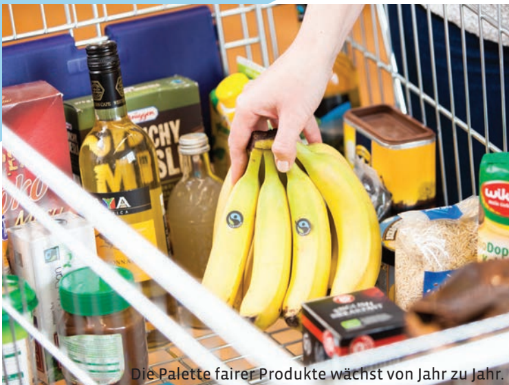
Die Palette fairer Produkte wächst von Jahr zu Jahr.

z.B. Kaffee, Tee, Kakao, diverse Säfte, Wein, Schokolade, Kekse, Honig, Bananen, Reis, diverse Cerealien, Nuss-Nougat-Creme, Rohrzucker, Pfeffer, Rosen oder Baumwollprodukte.