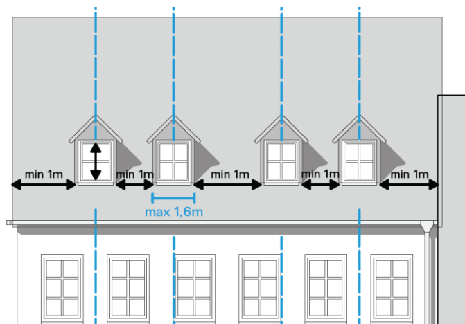
Abbildung 1: Dimensionierung und Platzierung von Dachaufbauten