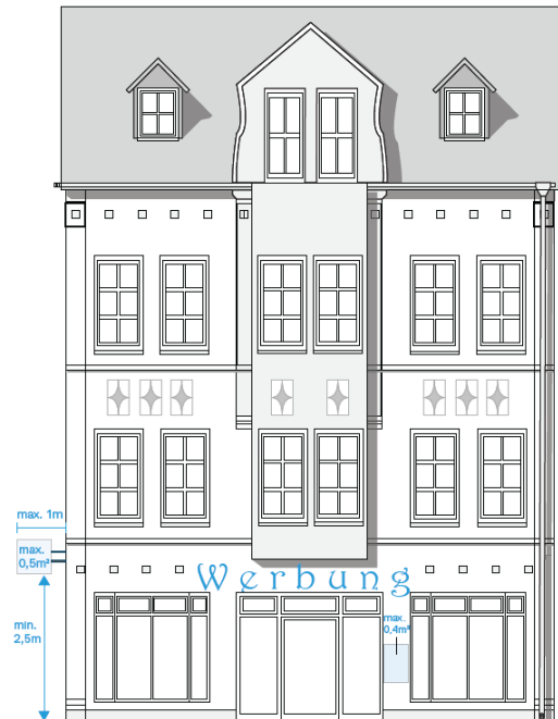
Abbildung 3: Dimensionierung von Werbeanlagen