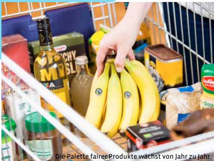
Die Palette fairer Produkte wächst von Jahr zu Jahr.

z.B. Kaffee, Tee, Kakao, diverse Säfte, Wein, Schokolade, Kekse, Honig, Bananen, Reis, diverse Cerealien, Nuss-Nougat-Creme, Rohrzucker, Pfeffer, Rosen oder Baumwollprodukte.