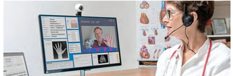
Ein denkbarer Anwendungsbereich von vielen: Tele-Medizin – der Arzt-Besuch via Video-Chat.