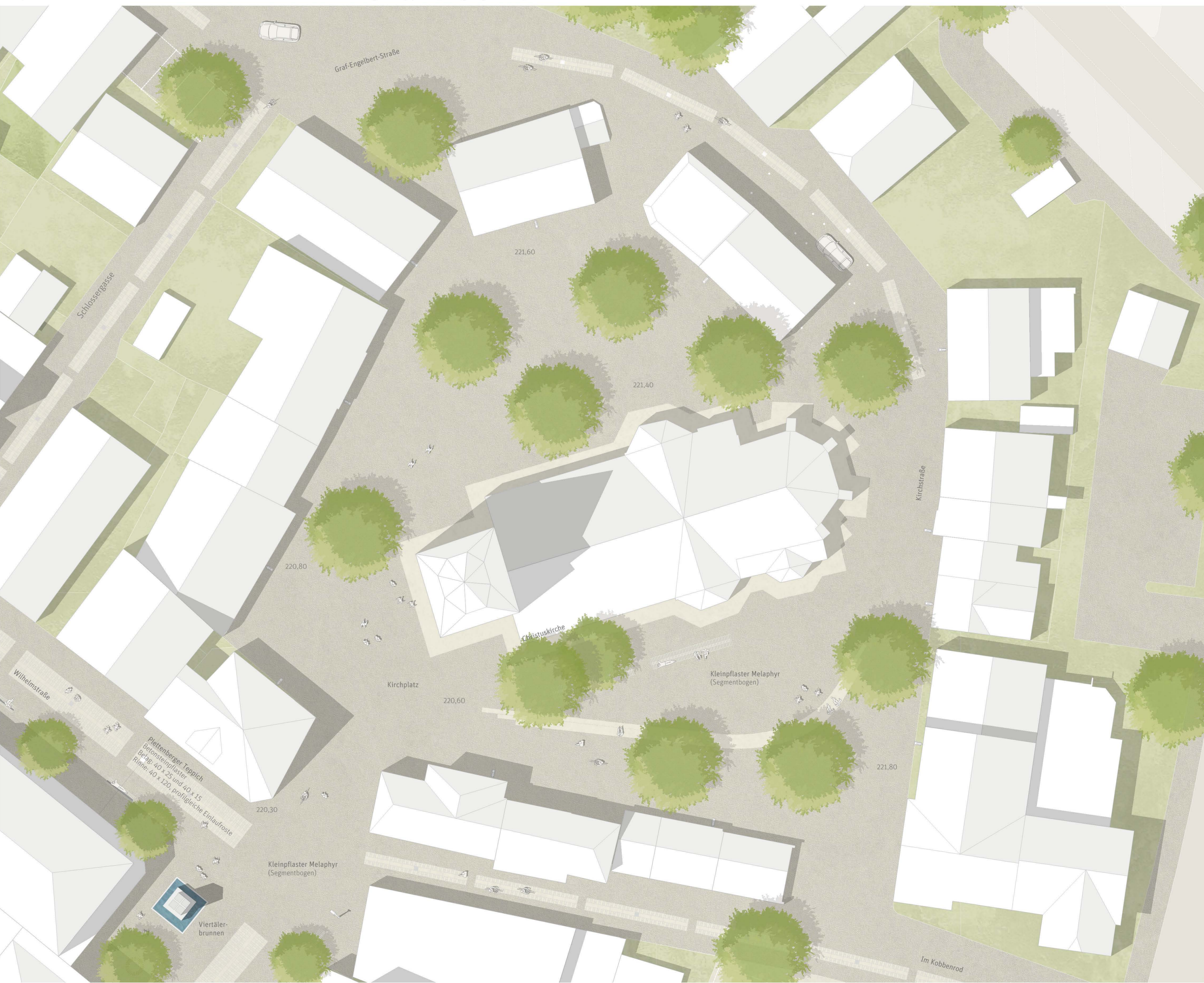
Detail Kirchplatz M 1:200