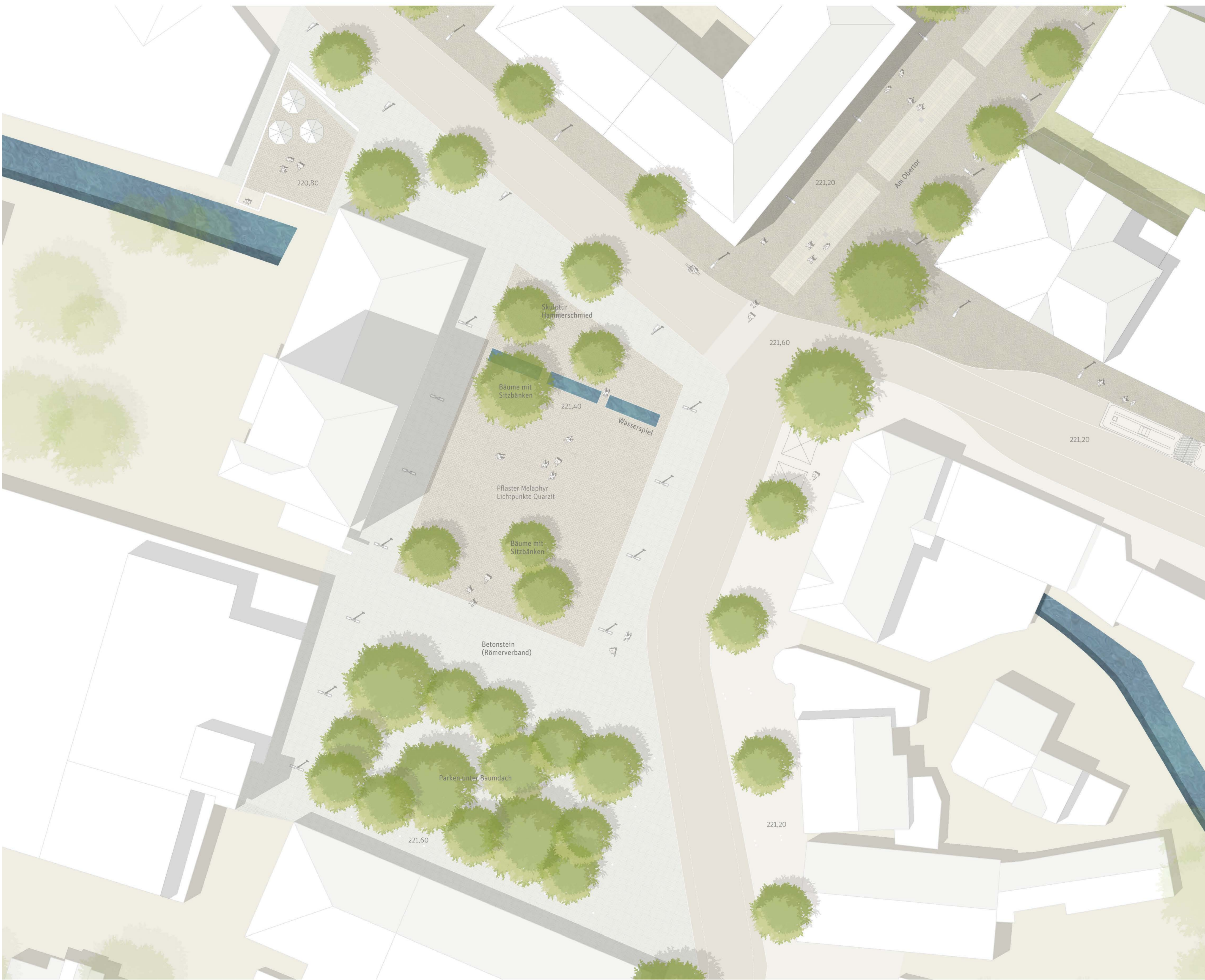
Detail Maiplatz M 1:200