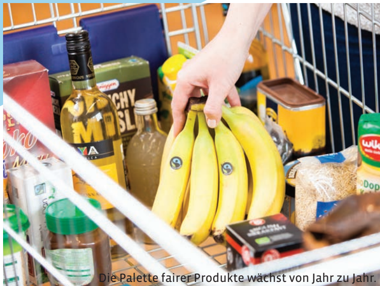
Die Palette fairer Produkte wächst von Jahr zu Jahr.

z.B. Kaffee, Tee, Kakao, diverse Säfte, Wein, Schokolade, Kekse, Honig, Bananen, Reis, diverse Cerealien, Nuss-Nougat-Creme, Rohrzucker, Pfeffer, Rosen oder Baumwollprodukte.